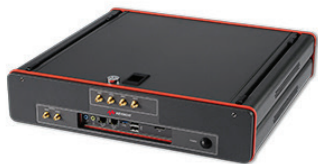
Модуль Nemo Autonomous Probe 4UE